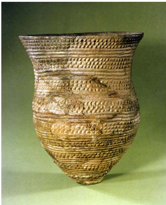
Foto van een klokbeker van gebakken klei gevonden in Barneveld. Door de vondst van dit soort klokbekers wordt de samenleving die zich omstreeks 2.000 v. Chr. ontwikkelt de "Klokbekercultuur" genoemd. Deze klokbeker met wikkeldraadmotief is 44 centimeter hoog: